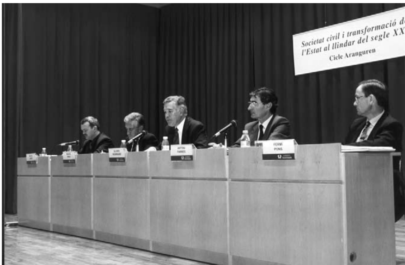
La tercera edició del cicle Aranguren va poder comptar amb la presència del president del Tribunal Constitucional.

Les ponències són a càrrec de set ponents, les intervencions dels quals es plantejaran la validesa de les actuals formes de govern centrades en la