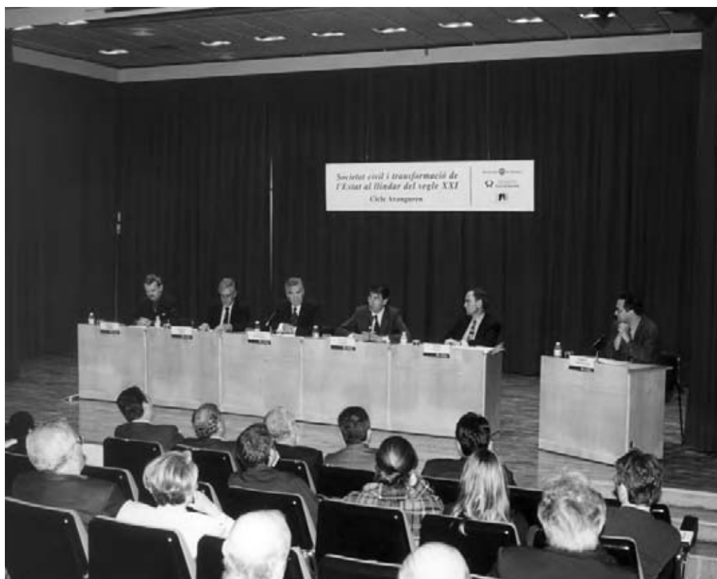
Enguany, el Cicle Aranguren s'ha realitzat també a la ciutat de Vic.

El fet d'anar plegats, en organitzar aquest cicle, amb l'Ajuntament de Sabadell i amb la Fundació Caixa de Sabadell ens indica que anem pel bon camí, i esperem continuar el mateix bon sender durant molts anys.