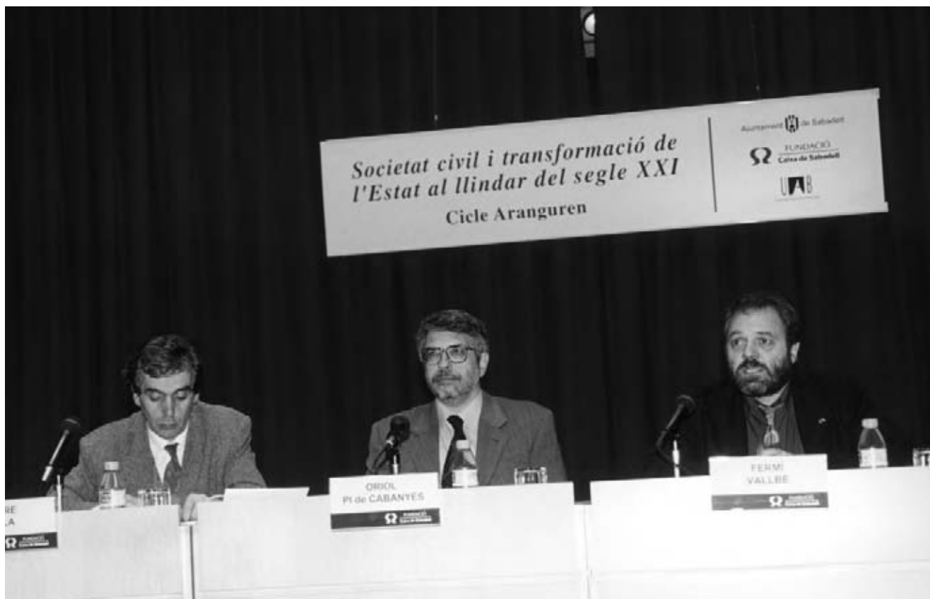
El professor Aranguren continua inspirant el cicle que du el seu nom.