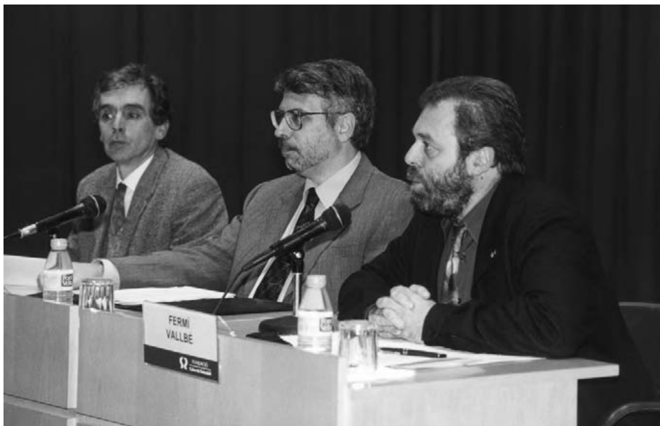
La raó de ser del Cicle Aranguren és la inquietud i l'interès dels ciutadans, de Sabadell i d'altres ciutats, que cada any s'interessen per les diverses sessions.

La qüestió de l'educació i la seva necessitat l'hem de tenir present al llarg de tota la vida, i per tant hem de tenir en compte que el concepte d'educació ha de ser molt més global. N'hi ha molts, d'exemples. Ahir mateix, en aquest mateix auditori, el centre de salut mental Antaviana ens presentava el seu treball cultural. Era una forma, també, d'educar tots els sectors de la població que tenen dificultats o alguna malaltia mental i que d'alguna manera el treball que fan entorn de la cultura i la formació,