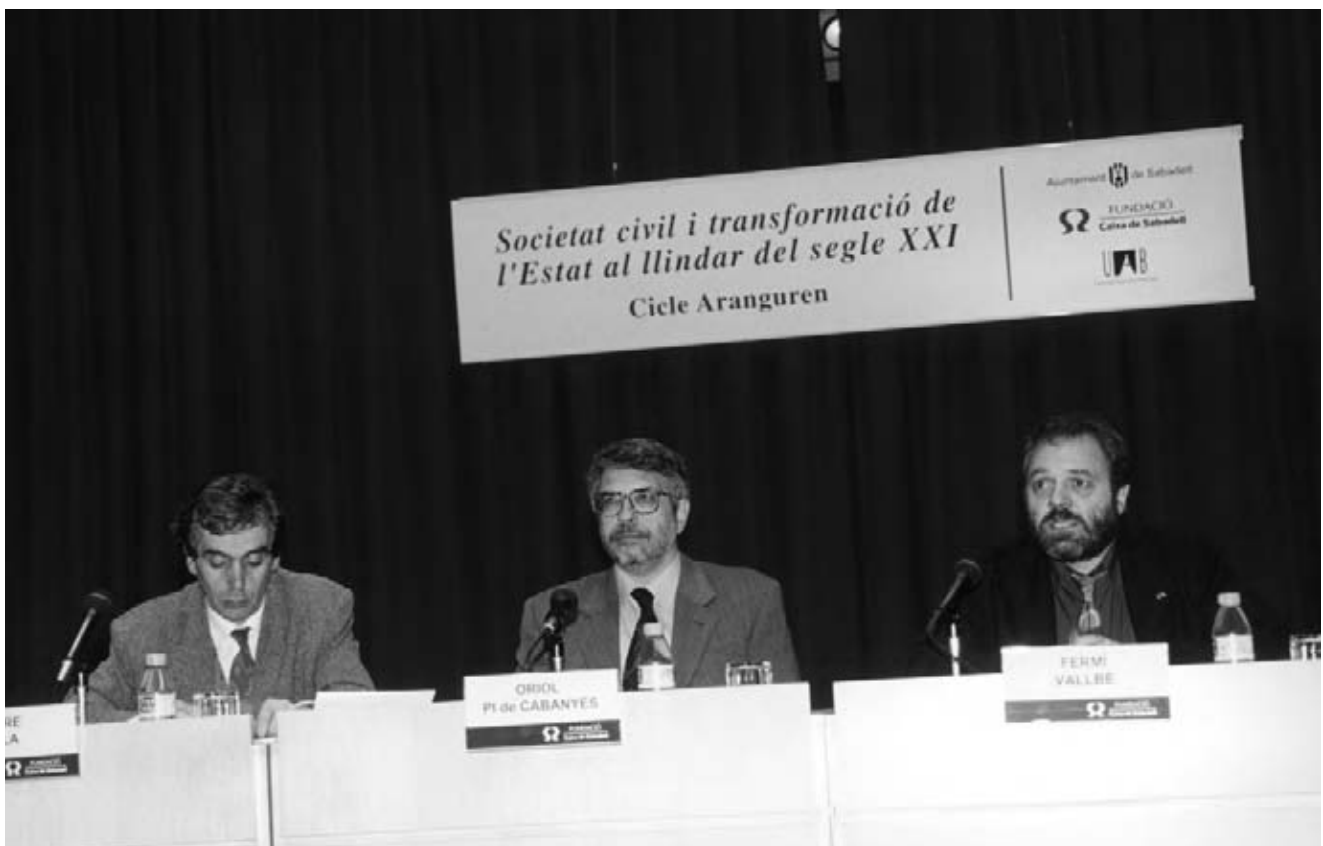
El professor Aranguren continua inspirant el cicle que du el seu nom.

escriure un llibre el 1983 que es deia España una meditació política . Em sembla que és molt interessant que a Catalunya, a Sabadell, anualment feu aquest Cicle en què honoreu i recordeu Aranguren com es mereix. A Catalunya va tenir grans amics, com Josep M. Castellet i Xavier Rubert de Ventós, i aquí va ser professor de l'Escola de Disseny Tèxtil que dirigia l'artista i pedagog Ramon Folch i Roca. Diverses obres d'Aranguren han estat traduïdes al català, com ara Religiositat intel·lectual , l'any 1966 i l'estudi El problema universitari , l'any 1968. Per acabar aquesta petita evocació del professor Aranguren, cal dir que va ser un gran amic de Catalunya perquè va fer aquest esforç intel·lectual,