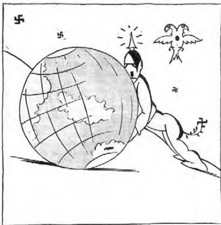
¿Quién podrá a quién? ( Luz . Madrid, 3-VIII-1934).

Després, el que sí ha estat la culminació del segle XX és l'Estat com a espectacle en el camp de la imatge. És a dir, en el seu temps Felip II es retratava d'una manera o feia un monestir, Felip IV feia una preciosa estàtua, a Barcelona es dedicava una estàtua a Rafael de Casanova. Ara el que caracteritza a aquesta fi de segle es que l'Estat s'està oferint constantment com a espectacle, de vegades espectacle degradat, com ho és, per exemple, la boda de les Infantes, que em sembla un espectacle de política